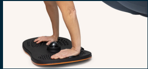
Verwenden Sie es als Trainingsgerät für Übungen wie die Planke, Liegestütze und Kniebeugen