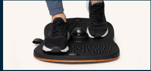
Hin und her kippen