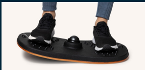
Vippa och balansera i sidled