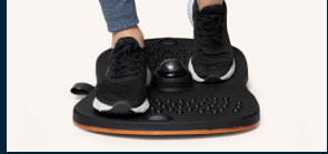
Tilt back and forth