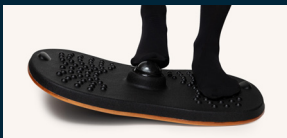
Massera fotvalvet på massagebollen