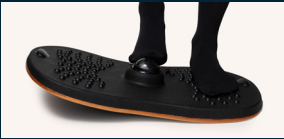
Massage the arch of the foot on the massage ball