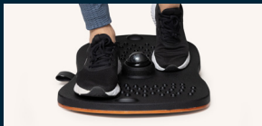
Vip frem og tilbage